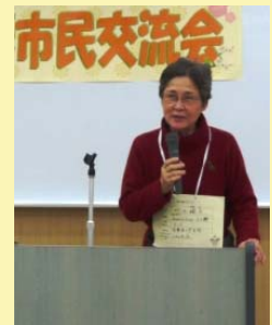
↑フリースピーチで活動をアピール

マジックや詩吟などのイベントやお楽しみが盛りだくさんで、趣向を凝らした内容が参加者同士の出会いを楽しく演出しました。