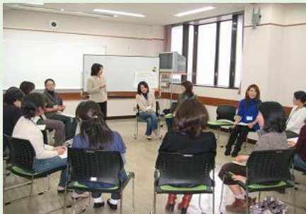
↑市民協働センターの コーチング講座の様子です。 気づきが多いと好評です。