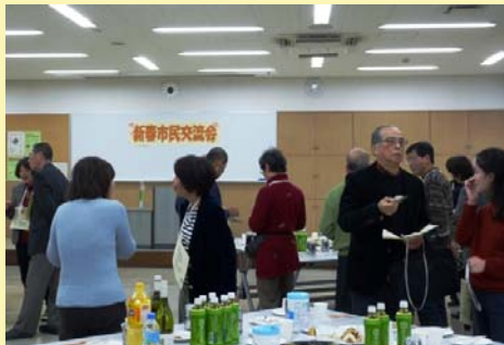
→ビンゴで景品を獲得

雪の舞うあいにくの天気になりましたが、わきあいあいと新春らしく楽しい雰囲気の中、市民の新春交流会を開催しました。