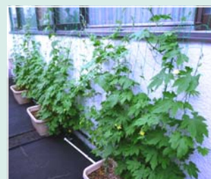
すくすく育つ センターのゴーヤ