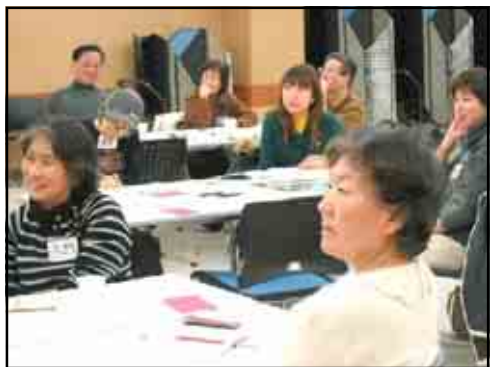
真剣に聞き入る参加者のみなさん

平成17年3月9日(水)「行き詰まりを解消するために」、3月14日(月)「まとまらない意見をまとめるために」というテーマで2日間にわたりマネジメント講座を行いました。ここでは1回目の様子をお伝えします。